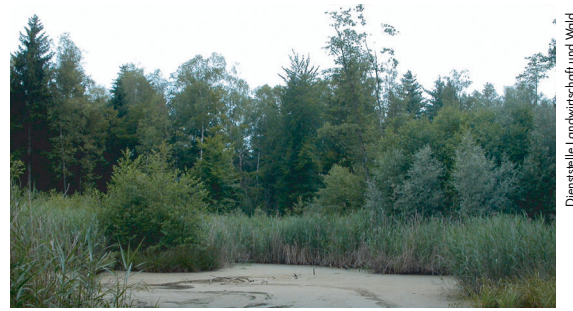
Diensstelle Landwirtschaft und Wald