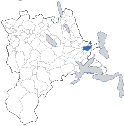
D4 Business Village Luzern mit Kreisell Längenbold