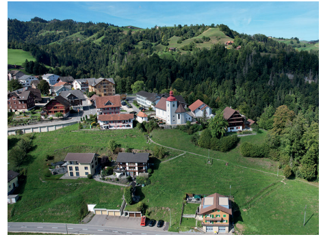
Blick auf Romoos