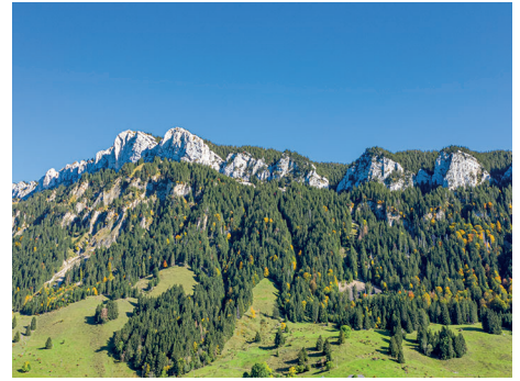
Schwändelifluh beim Dorf Flüeli